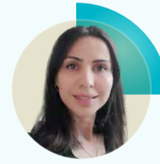
Tuba Yar Panelist